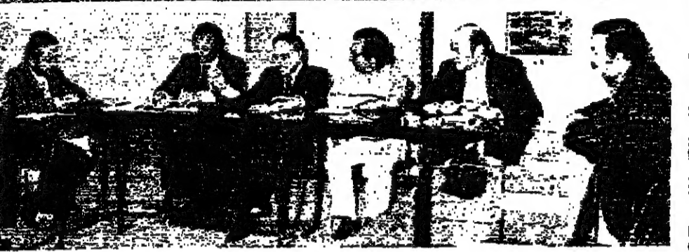
اجتماع في بورصة بيروت...